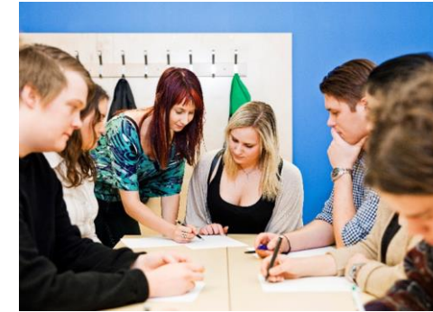
Taxonomi för skolor med skolbibliotek